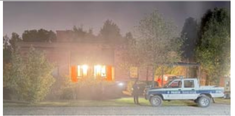
La vivienda donde ocurrió el robo.

El joven fue puesto a disposición de la Justicia por el delito de Robo, mientras continúan las diligencias de rigor bajo la órbita de la Fiscalía interviniente. ♦