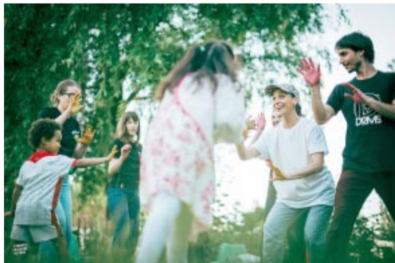
Presentando su proyecto Unproductive Will (Voluntad Improductiva) en Visueel Festival Visuel de Bruselas (2024).