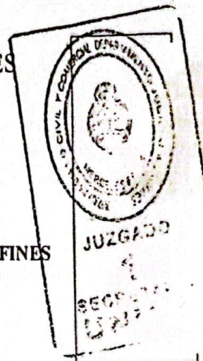
Sello del Órgano